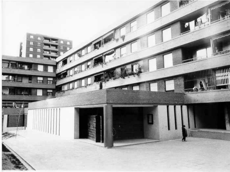
Párroco de Santa María de Fontarrón